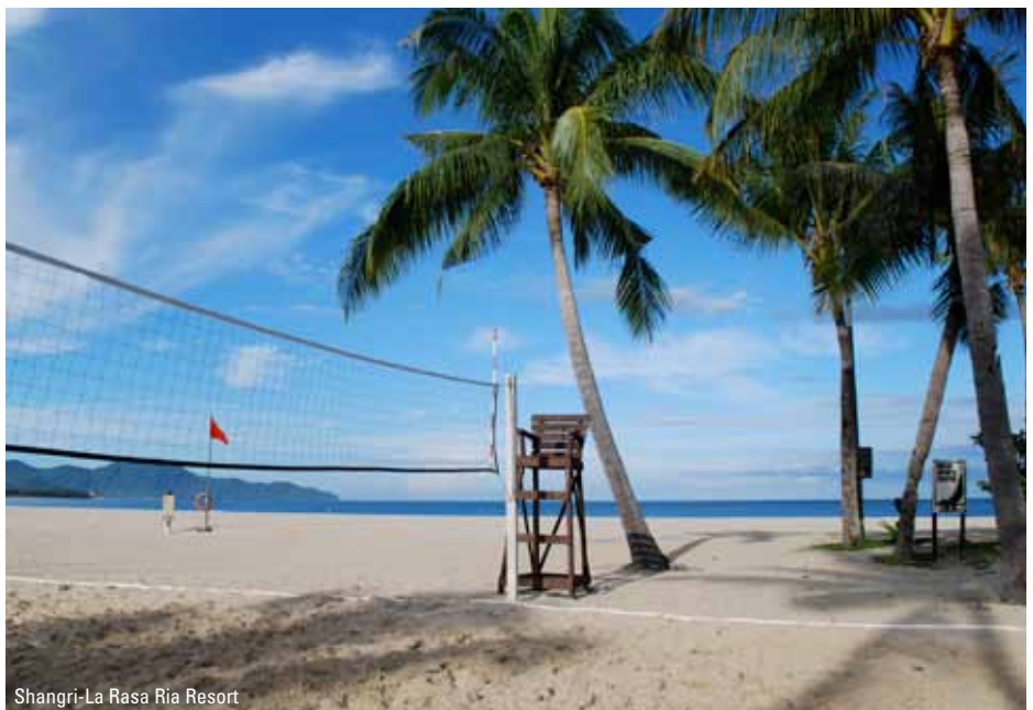
Shangri-La Rasa Ria Resort

Alle programførte udflugter og aktiviteter vil dog indgå.