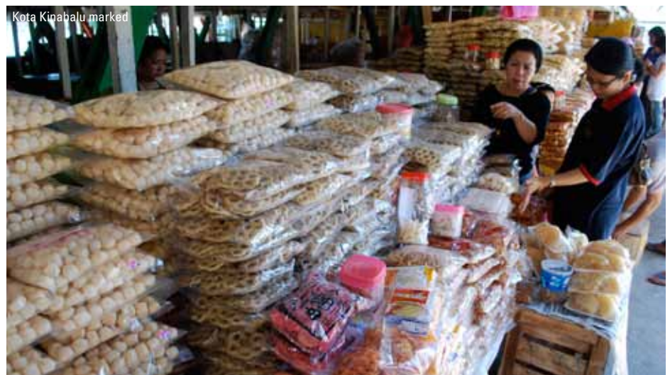
Kota Kinabalu marked

Vi bliver måske vækket af makabernes lange sørgmodige skrig, mens dagen langsomt gryer og godt det samme, for tidligt om morgenen (ca. kl. 6.00) begynder dagens første safari på floden. Dyrene er mest aktive om morgenen - måske er vi heldige at møde et par af regnskovens store skikkelser såsom orangutangen, en lille flok vilde elefanter, et par langarmede gibboner eller den karakteristiske næseabe. Hvis vejret tillader det, vil der også blive tid til en lille gåtur i junglen. Tilbage på lodgen spiser vi morgenmad, og om eftermiddagen er det tid til endnu et cruise. Resten af aftenen er herefter til fri disposition. Overnatning: Kinabatangan Riverside Lodge. (M,F,A)