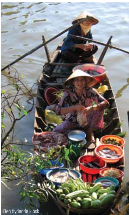
Den flydende kiosk