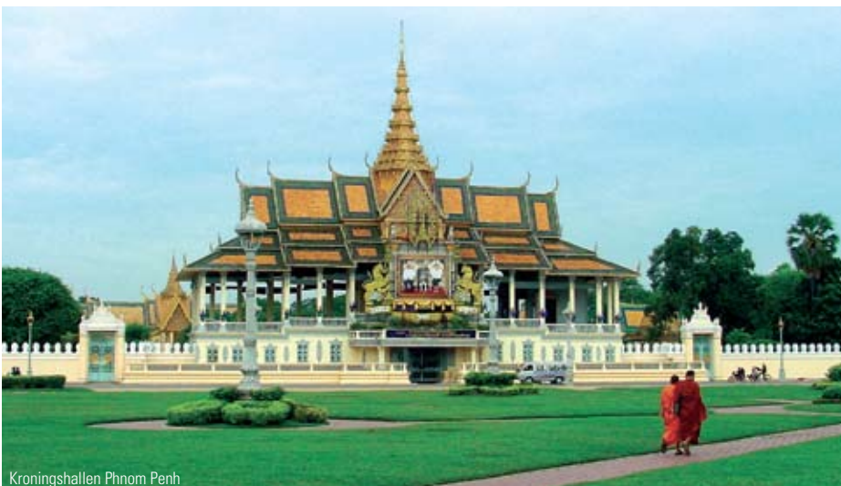
Kroningshallen Phnom Penh