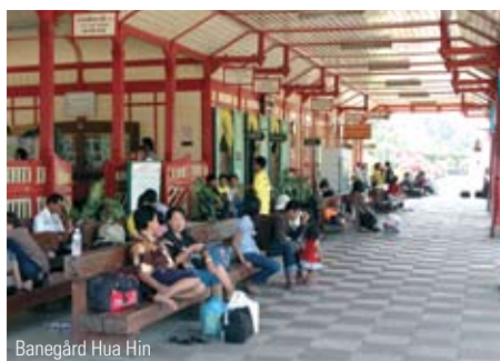
Banegård Hua Hin