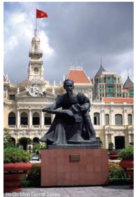
Ho Chi Minh Central Square