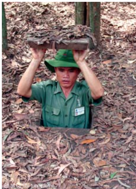
En af Cu Chi-tunnellerne

Efter morgenmaden kører vi til Cu Chi-tunnellerne - et tunnelsystem hvor de vietnamesiske modstandsfolk, Vietcong,