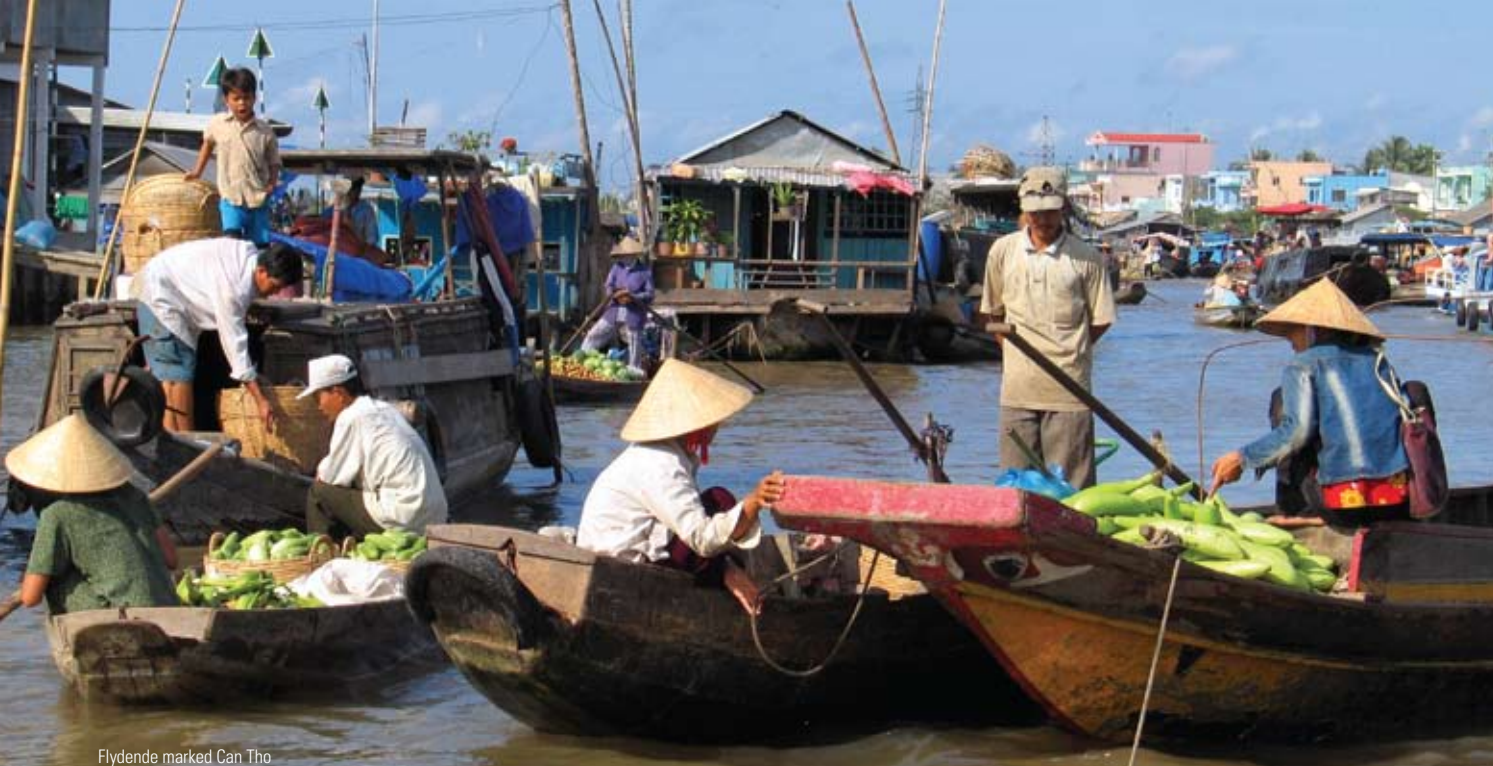
Flydende marked Can Tho