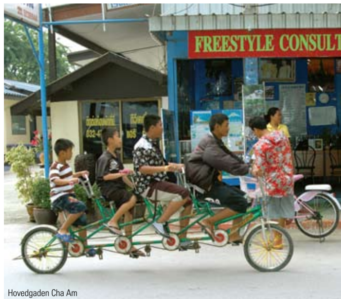
Hovedgaden Cha Am