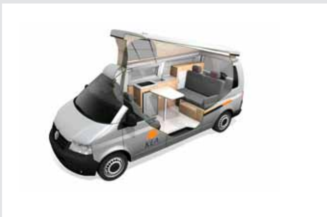
2+2 BERTH DELUXE FLIP-TOP VW T5 CAMPERVAN