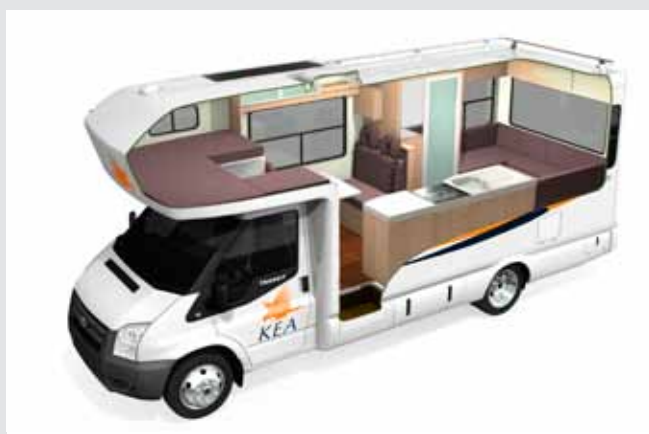
T 6 BERTH DELUXE MOTORHOME