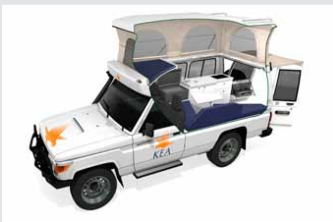
4WD DELUXE POP-TOP OFF ROAD CAMPERVAN

BOOK FØR 30 SEPT 11 10% RABAT afrejse 01/12/11-31/03/12 gælder ikke Flip Top Campervan