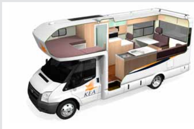
T 4 BERTH DELUXE MOTORHOME