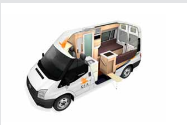
T 2 BERTH DELUXE CAMPERVAN.

BOOK FØR 30 SEPT 11 10% RABAT afrejse 01/12/11-31/03/12 gælder ikke Flip Top Campervan